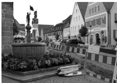
Das „Brunnenmännla“ hält wacker die Fahne hoch: Der Bauernmarkt kann schon bald wieder vor das Rathaus zurückkehren. Auch mit der Försterwiese geht es gut voran. Und der Döderleinsweg wird bereits in den nächsten Wochen wieder geöffnet sein.

Der Spielplatz soll bereits nach den Sommerferien nutzbar sein. Wo vor kurzer