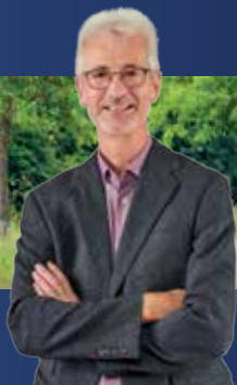
Markus Mahl - unser Bürgermeister