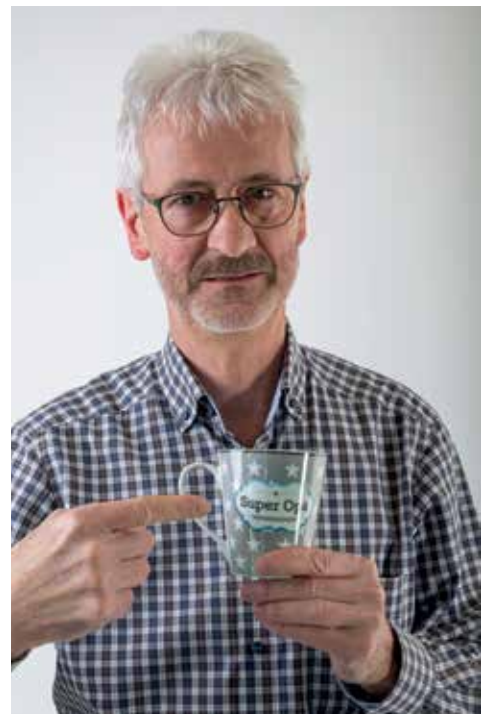
Was würden deine beiden kleinen Enkel zu deiner Politik der Nachhaltigkeit sagen?