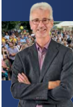
Markus Mahl - unser Bürgermeister