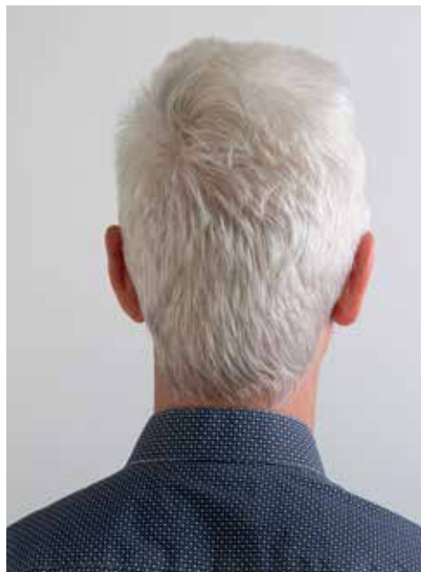
Welche Seite kennt man von dir kaum?