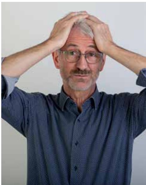
Was fällt dir ein, wenn du dir die Angebote für Tiefbaumaßnahmen anschaust?