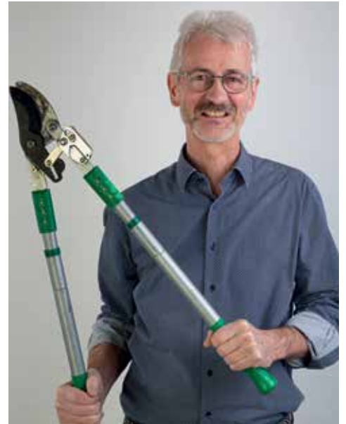
Wobei kannst du auch mal abschalten?