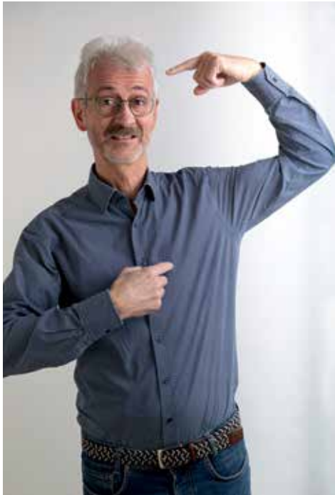
Womit möchtest du Hilpoltstein die nächsten sechs Jahre voranbringen?

tige schon vermittelt, dachte sich die Stadtspiegelredaktion und führte zur Auflockerung des Wahlkampfes ein Foto-Interview ohne Worte, in dem unser Bürgermeister nichts sagt und doch viel verrät.